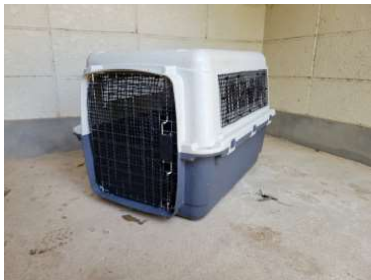
ケージを用いて移動