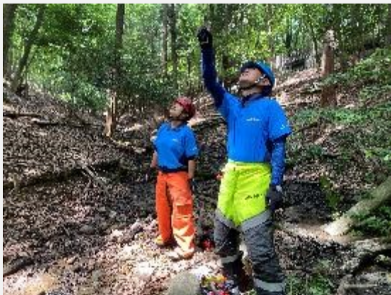
剪定する木を発見