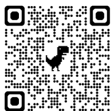
埼玉県県営公園施設予約サービス （外部サイト）