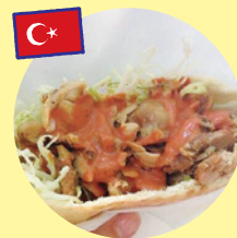
ケバブサンド (ナザルケバブ)