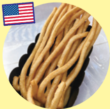
ロングフライドポテト (飯村商店)