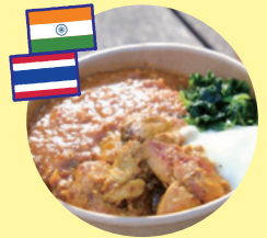
タンドリーチキン& キーマカレー (Kitchen Rarinju)