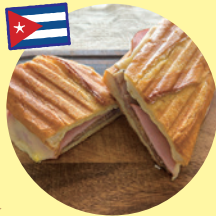
キューバサンド (AKIMO キッチン)