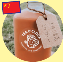
香港ミルクティー (TEA O'CLOCK)