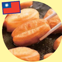
台湾あげはん (台湾屋台)