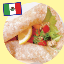
トルティーヤ (まるひる)