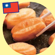
台湾あげはん (台湾屋台)