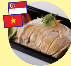
シンガポールチキンライス (Mr.Chicken)