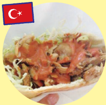
ケバブサンド (ナザルケバブ)