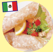
トルティーヤ (まるひる)