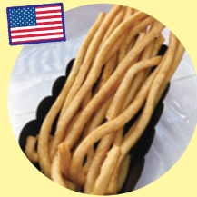
ロングフライドポテト (飯村商店)