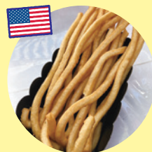
ロングフライドポテト (飯村商店)