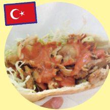
ケバブサンド (ナザルケバブ)