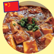
麻婆丼 (中華キッチンカー-紅秋)