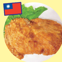
大鶏排 (スマイルダイニング)