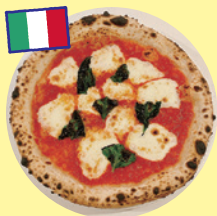
ナポリピザ (BANSUN FoodTruck)