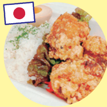
からあげ弁当 (ON 食)