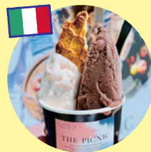
イタリアンジェラート (THE PICNIC)