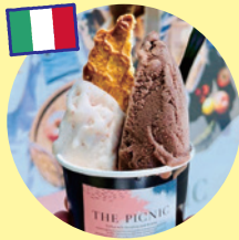
イタリアンジェラート (THE PICNIC)