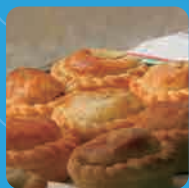
ミートパイ クラブオーストラリア