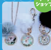
ワークショップ porta at