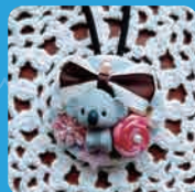
アクセサリ craft two