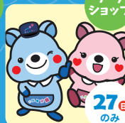
ワークショップ ぬりえ体験 アサヒロジスティクス