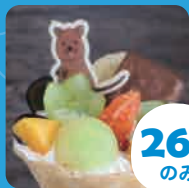
26 ± のみ タイムタムの フルーツ天国 ひだまり日和