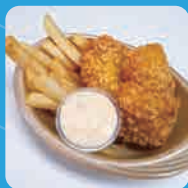
フィッシュ&チップス ガゼボ